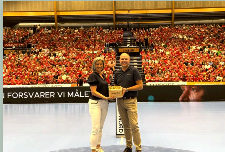
Complea donerer 20 kr. pr. redning hos Aalborg Håndbold. Rundet op blev det til 5.000 kr. ved sæsonafslutningen i 2024.