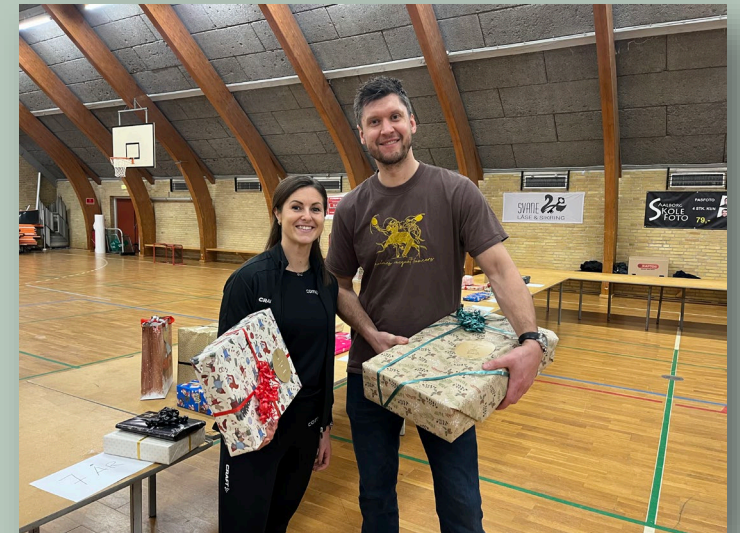
Julehjælp: Udlevering til Gestus Nord familier.