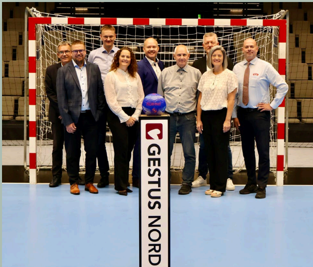
Gestus Nord børn har indløb med Kampbold hos Aalborg Håndbold til hver hjemmekamp.

Vi er blandt andet sølvsponsor hos Gestus Nord, som hjælper familier i Nordjylland med en håndsrækning. Derudover støtter vi medarbejdersponsorater, hvor en medarbejder typisk søger midler til at sponsorere spillerdragter eller andet til sit barns sportshold.